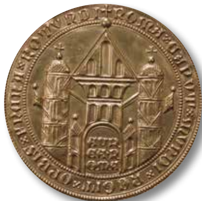
Zlatá bula Zikmunda Lucemburského - revers pečeti.

útrapy a finanční zátěž, kterou husitské války pro město znamenaly. Vedle přímého