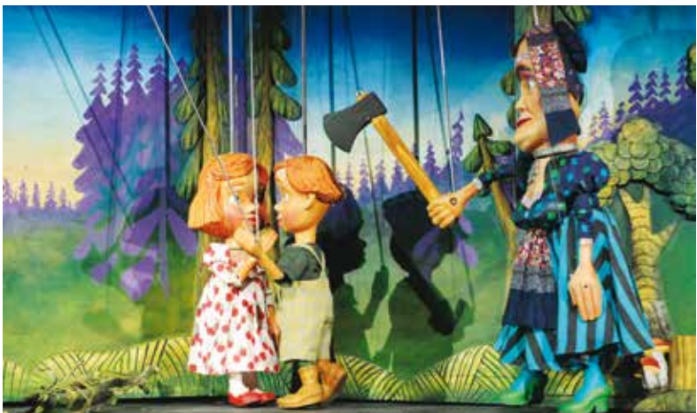
Perníková chaloupka v Divadle Alfa.