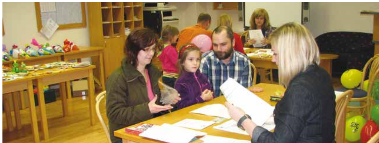
Na archivním snímku děti s rodiči u zápisu na 34. základní škole Plzeň.