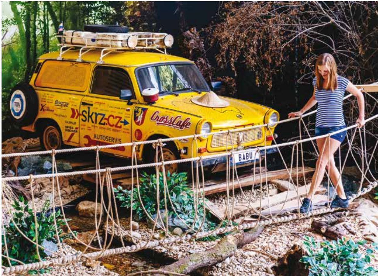
K vidění v DEPO2015 jsou trabanty a další vozítka.

Právě s ním bude možné se osobně setkat v depu, konkrétně 16. března v 17 a 19 hodin, 25. března ve 14, 16 a 18 ho-