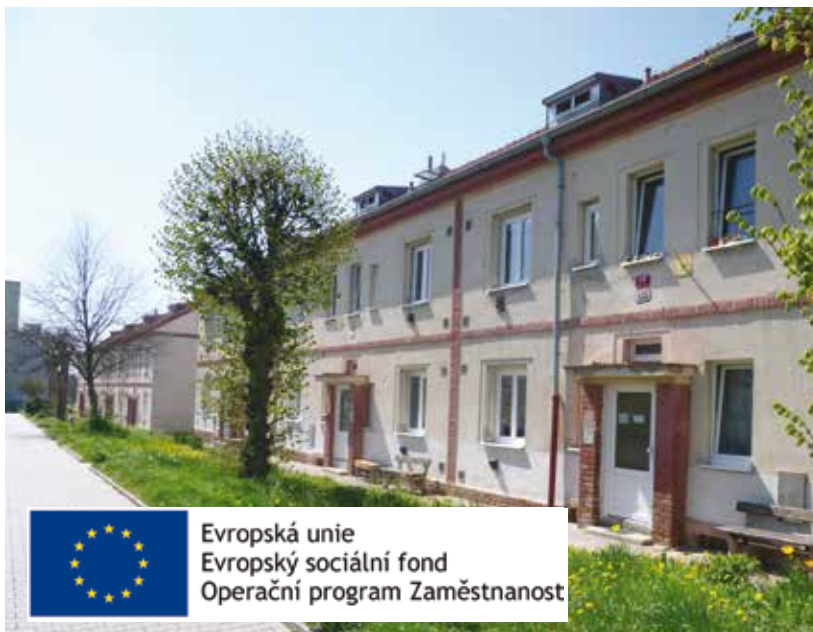
Na archivním snímku zrekonstruovaný objekt s byty zvláštního určení pro seniory v ulici Pod Vrchem.

„Vytvořením oddělení sociální práce a metodiky sociálního bydlení dojde k navýšení počtu zaměstnanců odboru o čtyři sociální pracovníky se specializací na práci s nájemníky sociálních bytů, čímž vznikne prostor věnovat se