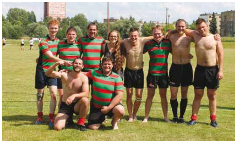
Plzeňští hráči rugby.