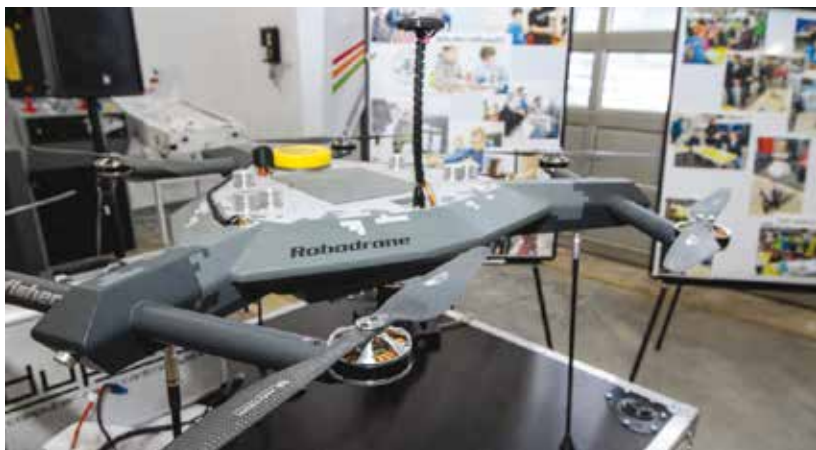
Bezpilotní letadlo Robodrone Kingfisher za 330 tisíc korun darovalo město Fakultě elektrotechnické Západočeské univerzity v Plzni. Poslouží k výuce studentů v rámci nově otevřených předmětů.