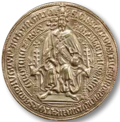
Zlatá bula Zikmunda Lucemburského - averz pečeti.

darování majetku nebo platů byla jednou z cest celková ekonomická podpora Plzně, vysílené posledním husitským obléháním v letech 1433 až 1434. Velmi důležité bylo pro město Zikmundovo privilegium vydané 19. září 1434 v Řezně a opatřené přivěšenou majestátní zlatou mincovní pečeti. Listina, psaná latinsky na pergameni o rozměrech 80 x 52,5 centimetrů se sedmicentimetrovým zesíleným okrajem – plikou, zdůrazňovala věrnost Plzeňských a proklamovala záměr nahradit škody, které město utrpělo během husitského obléhání. Mimo jiné garantovala Plzni osvobození od každoroční královské berně, potvrzovala právo vybírat v městských branách od všech trhovců mýto při příchodu i odchodu a především osvobo-