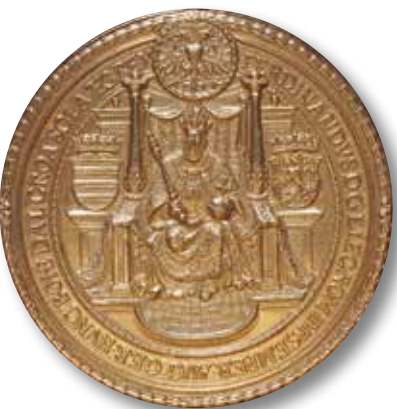
Zlatá bula Ferdinanda I. - averz pečeti.

Dne 1. února 2017 uplynulo 455 let od vydání zlaté buly, kterou císař Ferdinand I. potvrdil zlatou bulu svého předchůdce císaře Zikmunda Lucemburského. Ta byla velice důležitým dokumentem, který napomáhal hospodářskému rozkvětu města. Také díky tomu město zvládalo veškeré fiskální povinnosti, ale mohlo i formou půjček finančně vypomáhat panovníkovi. Ač nebylo postiženo restrikcemi za stavovské povstání roku 1547, „dobrovolně“ se opakovaně zavazovalo k placení posudného, tedy daně z výroby a prodeje piva, a roku 1557 svolilo k pětiletému placení cla z vyváženého dobytka. Věrnost panovnickému domu a prospěšnost královské komoře se ovšem městu vyplácela a Ferdinand I. i jeho nástupci drželi nad městem ochrannou ruku proti stavovské obci, která se bouřila proti jeho hospodářským výsadám.