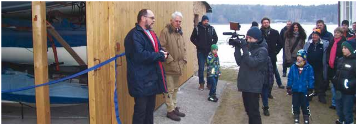
Slavnostní otevření zrekonstruovaného skladu lodí.