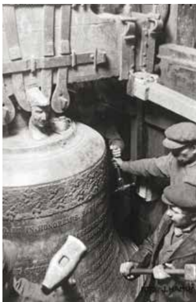
Rozbíjení zvonu Bartoloměj v roce 1917.

Zprávy o sarajevském atentátu se do Plzně donesly již 28. června 1914 před 17. hodinou, načež následovaly oficiální projevy smutku, který ovšem nepanoval všude. V červenci začala částečná mobilizace a nedlouho poté byla vypovězena válka. Tě se zúčastnilo asi 12 tisíc plzeňských mužů, z nichž jich minimálně 846 padlo, ale spolehlivá evidence neexistuje. Řada vojáků se zapojila i do nově vzniklých československých legií. Do Plzně byly povolány náhradní prapory z Uher a zdejší byly poslány do jiných měst, aby se zamezilo vzpourám. Ve městě fungovaly charitativní spolky a s péčí o raněné pomáhaly i úřady. Klíčové podniky byly prohlášeny za chráněné s vojenskou správou. Probíhaly rekvizice zejména kovových předmětů. Vedly se seznamy nespolehlivých osob a byla nastolena vojenská poštovní cenzura, která se nevyhnula ani dennímu tisku a výuce ve školách. Válka doléhala na obyvatelstvo především v oblasti zásobování potravinami. Zřízená aprotizační kancelář