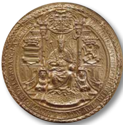
Zlatá bula Maxmiliána II. - averz pečeti.

Po smrti Ferdinanda I. v roce 1564 si nechali Plzeňští výsady obsažené v jeho zlaté bule potvrdit jeho nástupcem Maxmiliánem II. a to opět zlatou bulou, tedy druhou vydanou v rozmezí pěti let. Ač listina byla v podstatě jen potvrzení předchozího sta-