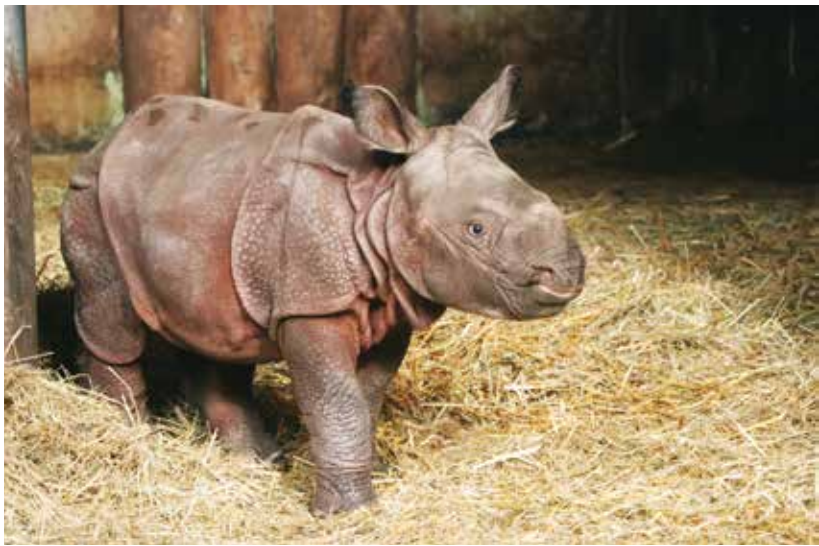
Nosorožčí mládě bude v plzeňské zoo zhruba dva roky, pak poputuje do jiné zoologické zahrady.

hladiny hormonů přesně určí, zda je samice březí,“ vzpomíná mluvčí plzeňské zoo Martin Vobruba. Druhý porod byl bezproblémový a rychlý. „Manjula byla od rána nervózní, chodila po výběhu osmičky. Po 23. hodině ji praskla voda a po jedné hodině ráno se narodila maličká. Rychle se postavila na nohy a začala pít mléko,“ říká ošetřovatelka a hlídá Růženku, která se přichází pomazlit. Matčino mléko, které je hodně sladké, bude pít do dvou nebo dvou a půl let, kdy dospěje a odjede do jiné zoologické zahrady. V té plzeňské je totiž místo jenom pro chovný pár. Také proto putovala Maruška, Manjulino první mládě, loni na jaře do nového domova v zoo Touroparc ve Francii, kde na ni čekal partner. Růženka k mléku ještě zkouší zeleninu. Na té, na seně, slámě a větvích si pochutnává i Manjula, která dostává navíc