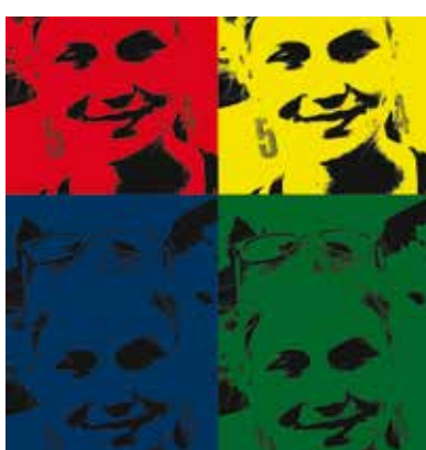
Ukázka práce, která vznikla během on-line jarního tábora s názvem Vyzkoušej si být fotografem.

Tábora s názvem Zimní hrátky ve Scratchi se zúčastnilo 7 chlapců a 2 dívek. V prvních dvou dnech se zaměřili na práci v grafickém editoru Canva, jenž se používá k vytváření grafiky, prezentací, plakátů a mnoho dalšího. Tento editor