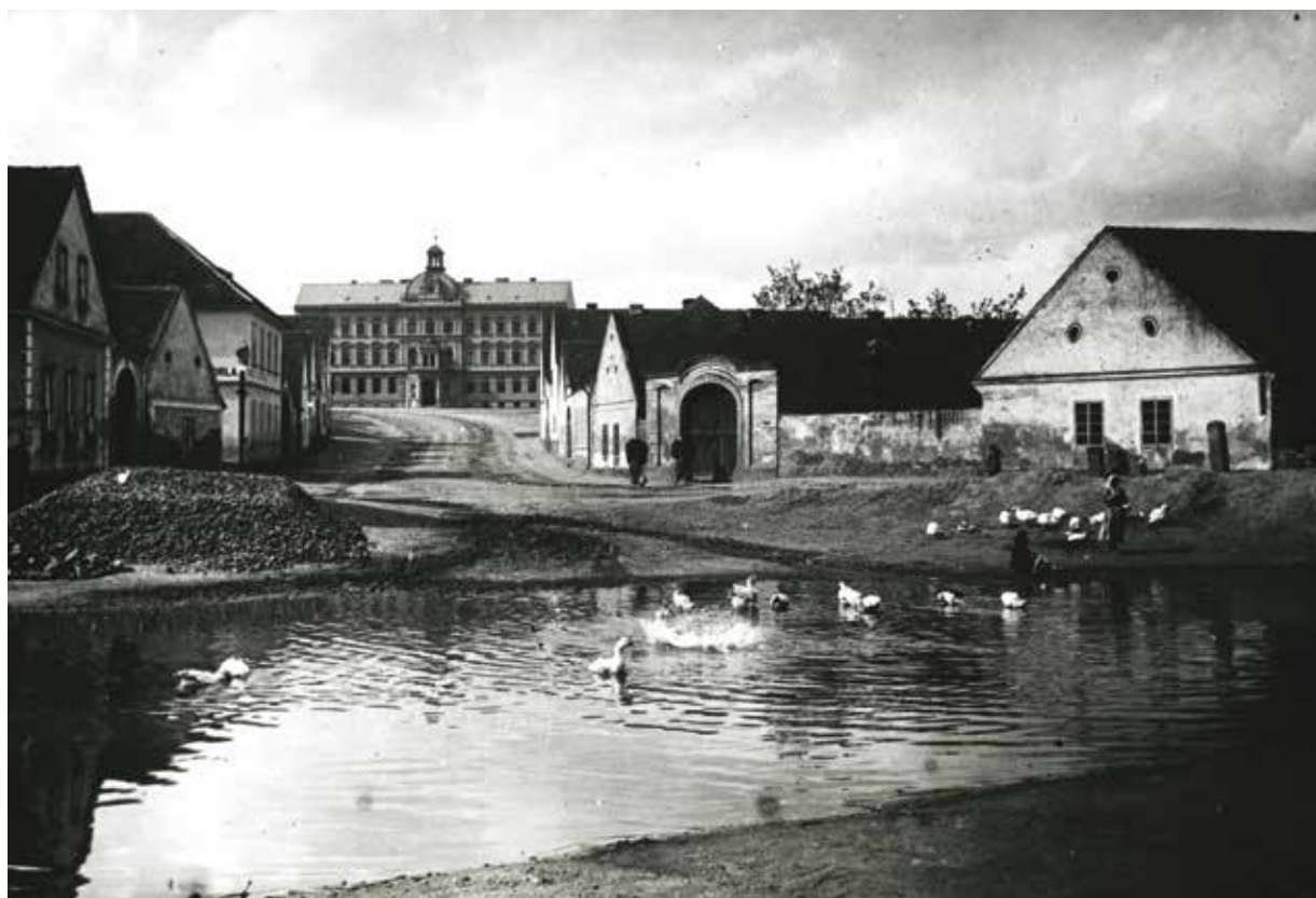
Snímek z přelomu 19. a 20. století ukazuje pohled ze skvrňanské návsi na budovu školy.

Kvůli zmíněnému připojení Skvrňan k Plzni muselo dojít k úpravě uličního názvosloví, jelikož se řada jmen shodovala s těmi plzeňskými. V tomto případě došlo ke zmenšení počtu veřejných komunikací, protože několik ulic bylo spojeno v jednu delší. Například z původních ulic Horymírova a Libušina se stala ulice Na Stráních, z ulice Sladkovského a náměstí Svatopluka