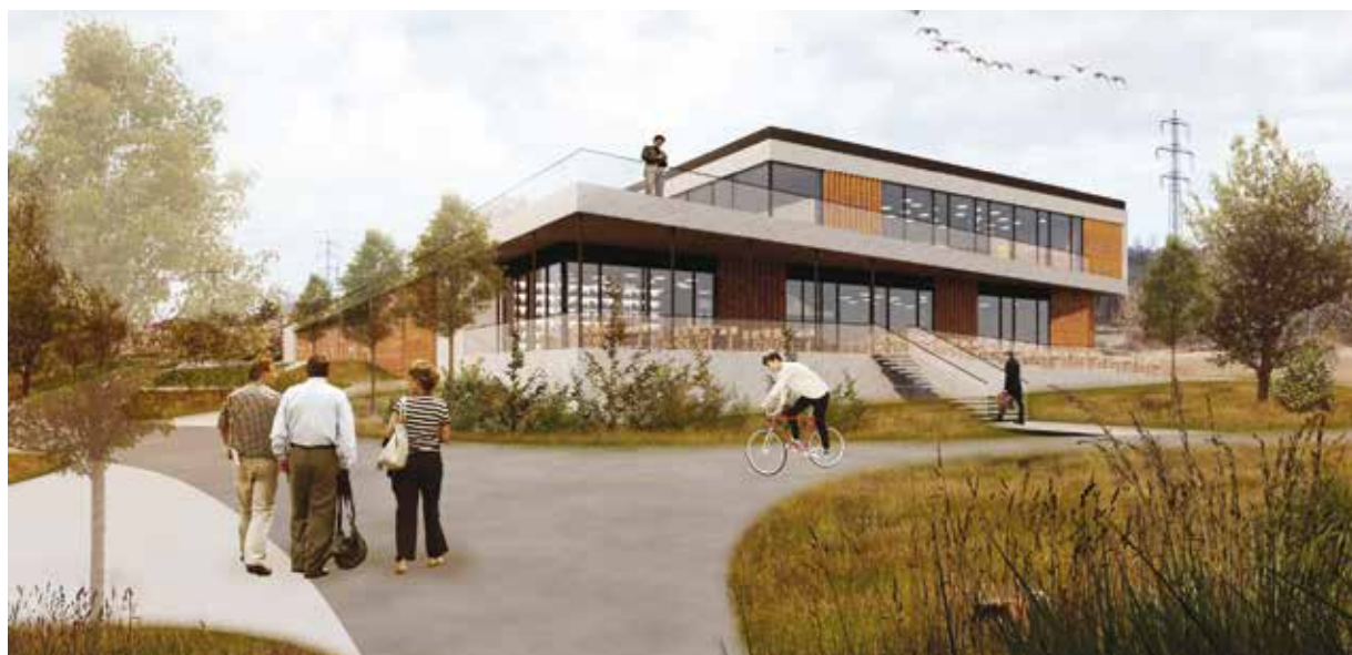
Vizualizace ukazuje, jak bude vypadat městská sportovní hala Krašovská.

Město dlouhodobě koncepčně podporuje volnočasové sportovní aktivity dětí, mládeže i dospělých. Nový víceúčelový objekt v Krašovské rozšíří možnosti sportovního vyžití nejen pro obyvatele Košutky, Bolevice a Lochotína, ale celé Plzně a blízkého okolí. Součástí objektu bude i restaurace pro 70 osob s venkovní terasou. Hala, její zázemí a restaurace budou mít ploché střechy, vzniknou zde pobytové terasy v kombinaci se zelenou střechou. Hala bude mít vlastní parkoviště s 52 parkovacími stáními a možností zajištění autobusu, nebudou chybět stojany pro jízdní kola. Na parkoviště povede nově vybudovaná účelová komunikace, která se napojí na Krašovskou ulici.