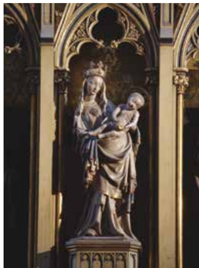
Plzeňská madona z roku 1384 z dílny Petra Parléře a svatovítské huti je umístěna na hlavním oltáři v katedrále sv. Bartoloměje a je jedním ze symbolů města.

Výstava byla zahájena loni v listopadu, ale kvůli všem protikoronavirovým opatřením byla do konce letošního dubna veřejnosti přístupná pouze 19 dní. ZČG proto zprostředkovala výstavu divákům v on-line