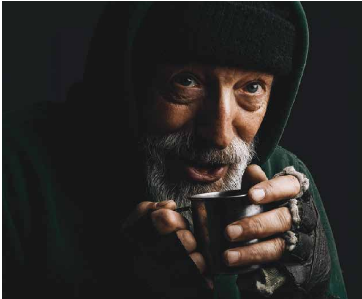
Město Plzeň se rozhodlo realizovat výzkumnou studii o bezdomovectví. Vzniká na Západočeské univerzitě.

Cílem této studie je najít průniky mezi těmito skupinami, tedy najít styčné body a pozmenit situaci. Jejím realizátorem je Katedra sociologie Fakulty filozofické, Západočeské univerzity (ZČU) v Plzni. V současné chvíli se výzkum nachází