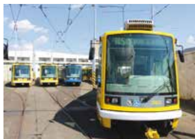
Tramvaje ASTRA vyjely na pravidelné linky do plzeňských ulic naposledy letos na jaře.

Po téměř čtvrt století přestaly letos na jaře v Plzni jezdit tramvaje typu LTM 10.08, známé pod názvem ASTRA. Rozsáhlou obměnu vozového parku zahájily Plzeňské městské dopravní podniky (PMDP) v roce 2019. Letos vypisují výběrové řízení na dodávku velkokapacitních tramvají velikosti XXL.