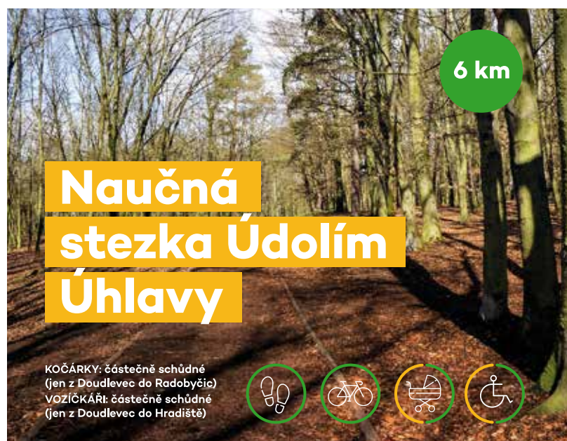
Takto vypadá jedna stránka z informativních letáků, které vydalo město ke svému projektu Plzní po stezkách.

Otevírací doba: všední dny od 9 do 15:30 hodin