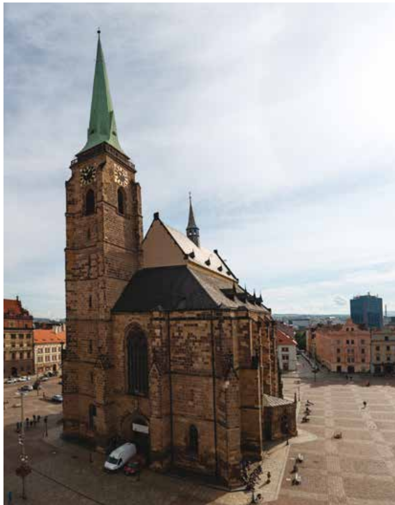
Katedrála sv. Bartoloměje na náměstí Republiky prošla rozsáhlou revitalizací a slavnostně znovuotevřena bude na začátku června.

Slavnostní otevření katedrály je naplánováno na středu 2. června v 18 hodin, kdy se uskuteční koncert Plzeňské filharmonie . Zazní například Korunovační intrády Jiřího Ignáce Linka nebo Te Deum Antonína Dvořáka. Koncert přenášá TV Noe a bude ke zhlédnutí na sociálních sítích plzeňského biskupství a města Plzně. Ve stejný den v 11 hodin se na náměstí Republiky uskuteční vernisáž výstavy s názvem Srdce Plzně, srdce diecéze a otevře se expozice v nově zpřístupněných prostorách v podkroví katedrály. Ve čtvrtek a v pátek 3. a 4. června bude katedrála poprvé po třech letech zpřístupněna veřejnosti. Na sobotu 5. června od 17 hodin je připraven koncert s názvem 3 varhany a 4000 písní . Zahájí ho plzeňský biskup Tomáš Holub, který požehná novým katedrálním varhanám. V neděli 6. června od 10 hodin celebruje biskup Tomáš Holub první nedělní mši svatou . V 18 hodin se uskuteční charitativní koncert Opera v katedrále , který připravuje ženský sbor Divadla J. K. Tyla, jeho hosté a katedrální regenschori Aleš Nosek. Další informace na www.bip.cz . (red)