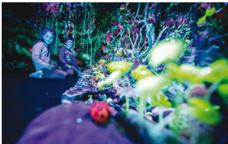
Výstava BLIK BLIK Tajuplný les je už v areálu DEPO2015 instalována.

Návštěva výstavy se řídí aktuálními hygienickými opatřeními. Organizátoři počítají, že otevřena bude několik měsíců až do letošního podzimu. Pořadatelé připravují také zajímavé doprovodné akce. Více informací na www.depo2015.cz .