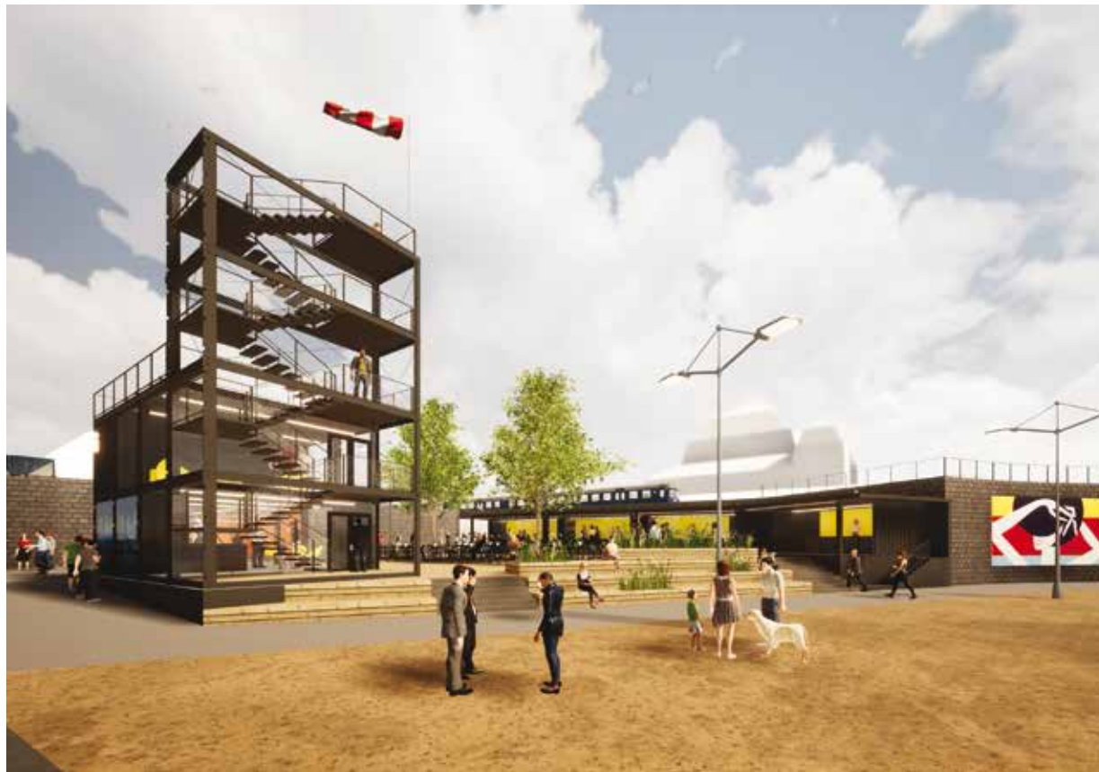
Vizualizace ukazuje, jak bude vypadat prostor u plzeňského Hlavního nádraží.

Infocentrum bude pro příjezdějícího návštěvníka prvním místem, kde se setká s Plzní. Tomu bude odpovídat i nabídka služeb. Návštěvník u nás dostane orientační plán města, propagační tiskoviny a zakoupí si zde i jízdenky MHD. Naše obsluha bude připravena poskytovat informační servis o turistických lákadlech a dění ve městě i regionu, to vše 7 dnů