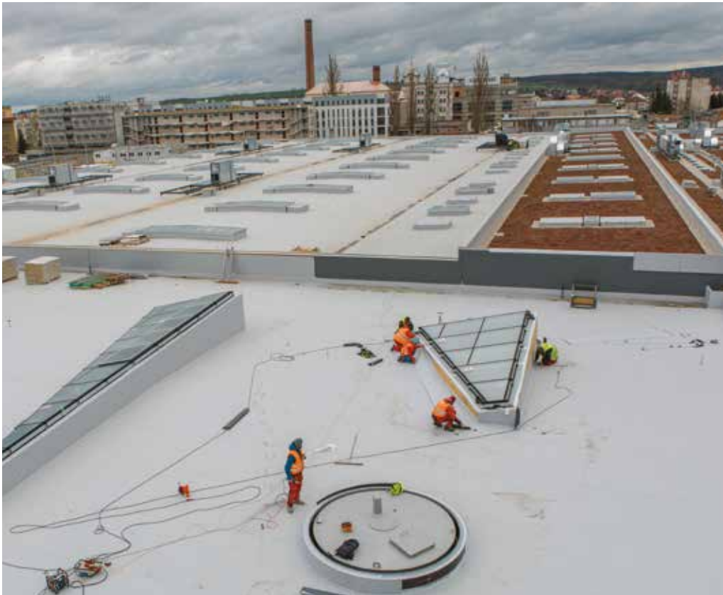
Na rozsáhlé střeše modernizované tramvajové vozovny budou zelené střechy, které sníží míru tepelné zátěže a přispějí k hospodárnému využívání dešťové vody. Přebytečná voda bude jímána do nádrže a dále využita jako voda technologická pro mytí tramvajových vozidel.

Od dubna je na Slovanech ve zkušebním provozu hala pro opravy a údržbu tramvají