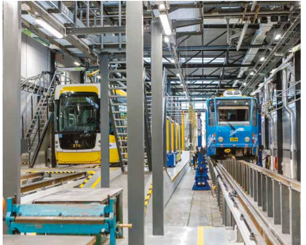
Nová hala oprav a údržby má čtyři paralelně vedené průjezdné koleje, které jsou oddělené stěnami – mycí linku, koleje na denní údržbu a na opravy podvozků a soustružnické pracoviště. Na každou kolej se vejdou tři dlouhé soupravy, každá o délce zhruba 35 metrů.