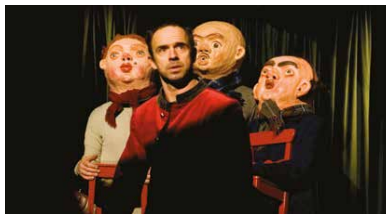
Obludárium Divadla bratří Formanů zavítá na zahradu Měšťanské besedy na konci srpna.

Nevedení zážitek přinese obnovená premiéra legendárního varietního show Divadla bratří Formanů Obludárium. V šapitó, které vyrostlo koncem srpna na zahradě Besedy, se jako obludy představí Kristýna