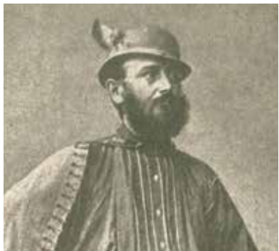
Vilém Šel.

Vilém Šel (v matrice narozených uváděn jako Wilhelm Carl Adolf Schelle) se narodil 14. února 1830 v Plzni jako syn plzeňského měšťana a zednického mistra. Po absolvování obecné školy v Plzni a ve Vídni pokračoval ve studiu na plzeňském gymnáziu, kde se v roce 1848 stal členem studentské legie. Medicínu studoval na lékařské fakultě Karlo-Ferdinandovy univerzity v Praze, promoval v roce 1855.