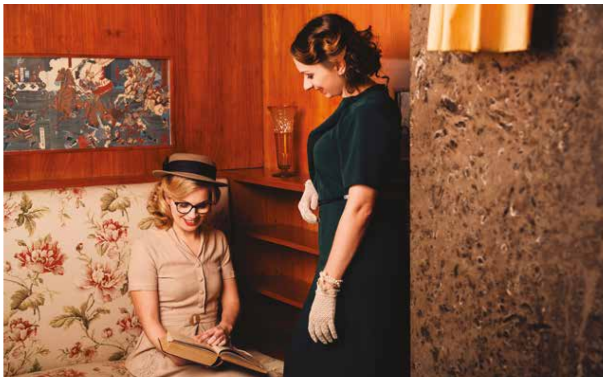
Loosovy interiéry jsou jedním z nejznámějších plzeňských turistických cílů. Organizace Plzeň-TURISMUS rozšířila nabídku prohlídek a pořádá v nich také kulturní pořady.

Termíny prohlídek v plzeňských Loosových interiérech zájemci najdou na portálu Plzeňská vstupenka. (red)