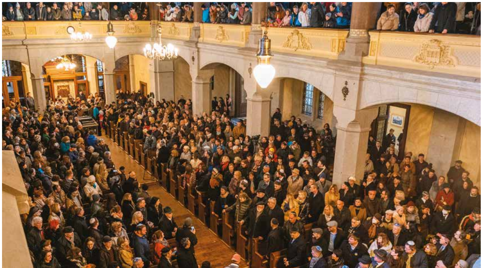
Velká synagoga v Plzni byla po třileté rekonstrukci za velkého zájmu veřejnosti slavnostně otevřena 10. dubna.

Městská příspěvková organizace Plzeň-TURISMUS nově zařazuje do své nabídky komentované prohlídky této pseudorománské budovy s maurskými prvky otevřené v roce 1893, která byla postavena z prostředků, jež mezi sebou vybrali pl-