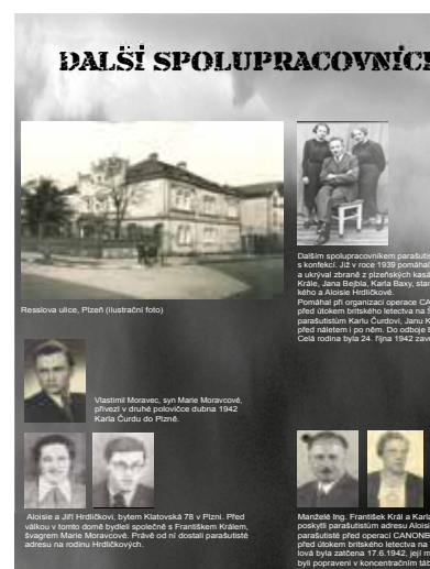
Takto vypadá jeden z panelů výstavy v mázhauzu plzeňské radnice. Připomíná osudy plzeňských rodin, které pomáhaly parašutistům.