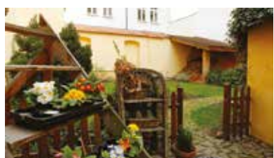
Takovéto zákoutí nabízí dvorek v Pražské 5.

Nadace 700 let města Plzně pořádá už poslední oblíbenou akci Plzeňské dvorky, která představuje známá i méně známá zákoutí Plzně. V sobotu 14. května od 10 do 18 hodin budou otevřeny na tři desítky dvorků.