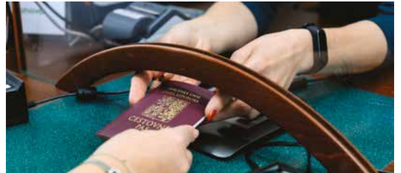
Oddělení občanských průkazů a cestovních dokladů, které sídlí na náměstí Republiky 16, vydá ročně více než 30 tisíc dokladů (občanských průkazů a cestovních pasů).

Pod Odbor správních činností MMP patří kromě oddělení občanských průkazů a cestovních dokladů také oddělení správní, oddělení dopravních přestupků a oddělení Zprostředkující subjekt ITI. Těmto oddělením se budeme věnovat v dalších číslech Radničních listů. (red)