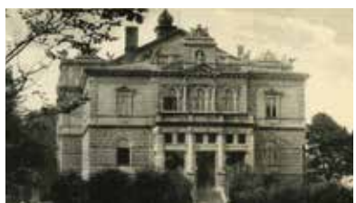
Sokolovna Na Obcizně.

Jednou z nejvýraznějších staveb v městských sadech je budova sokolovny Sokola Plzeň 1. Byla postavena v letech 1892–1896 v prostoru městských sadů Na Obcizně (následujícího roku byl tento prostor přejmenován na Pecháčkovy sady a v roce 1946 na Sady Emila Štruncy, dnes Štruncovy sady). K jejímu slavnostnímu otevření došlo 9. února 1896, dokončená a předaná veřejnosti byla ale až koncem června téhož roku. Jedná se o dvoupodlažní neorenesanční budovu obdélníkového půdorysu. V přízemí je vestibul, z něhož vede jednoramenné schodiště do předsálí ve zvýšeném přízemí a odtud pokračuje hlavní schodiště do patra. Sál s galeriemi a pódium je v zadní (vyšší) části budovy. Interiéry jsou dosud