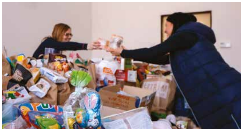
Pracovnice magistrátního odboru sociálních služeb třídí sbírku Nový začátek.

Do sbírky mezi 1. až 11. dubnem přispěli nejen zaměstnanci plzeňského magistrátu, ale i občané, kteří výzvu zachytili na sociálních sítích. Výtžek sice nebyl tak velký jako v předchozích letech, což je dáno především skutečností, že podobné sbírky, cílené zejména na pomoc běžencům z Ukrajiny, jsou stále aktivní napříč společností, ale i tak bude možno podělit všechny, pro které byla sbírka zamýšlena.