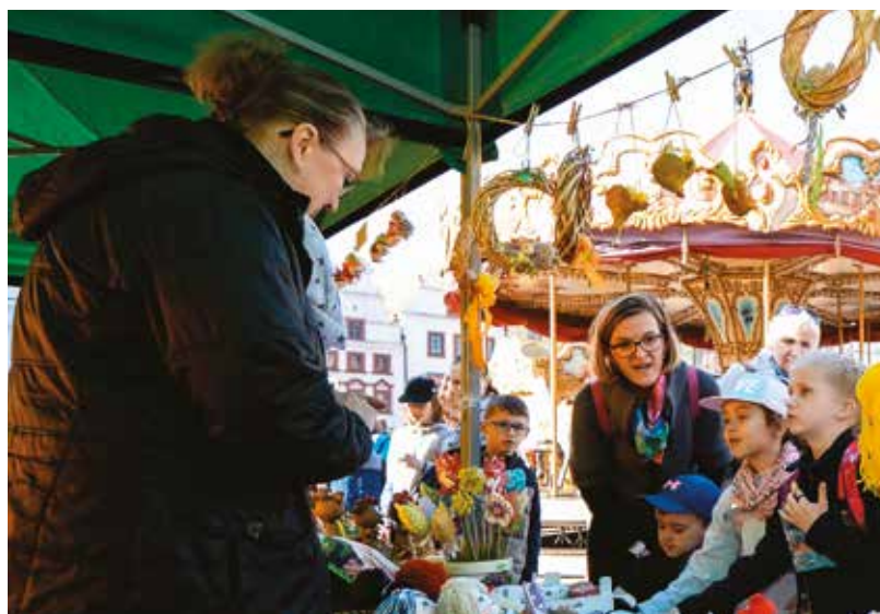
Akci Šikovné ruce vrátil na letošní velikonocní trhy na náměstí Republiky Odbor sociálních služeb Magistrátu města Plzně.

Po dvouleté přestávce se na Zelený čtvrtek vrátila na plzeňské velikonocní trhy tradiční prodejní výstava Šikovné ruce. Na ní mohli lidé zakoupit výrobky z terapeutických dílen zdravotně postižených z Plzně a okolí. Zájem veřejnosti byl, stejně jako v předchozích letech, velký. Kvalitní rukodělné práce v podobě různých velikonocních dekorací i drobných textilních výrobků vytvořili klienti Centra pobytových a terénních služeb Zbůch, Sdružení Ty a Já, Sociálních a prorodinných služeb Motýl, Spolku neslyšících Plzeň a spolku Tak pojd' s náma. S novinkou ze zcela jiné oblasti než rukodělné se představilo Sdružení občanů Exodus, které na náměstí prezentovalo své dovednosti v oblasti digitalizace v rovině převodu kazet VHS, rodinného fotoalba či diazitivů do digitální podoby. (red)